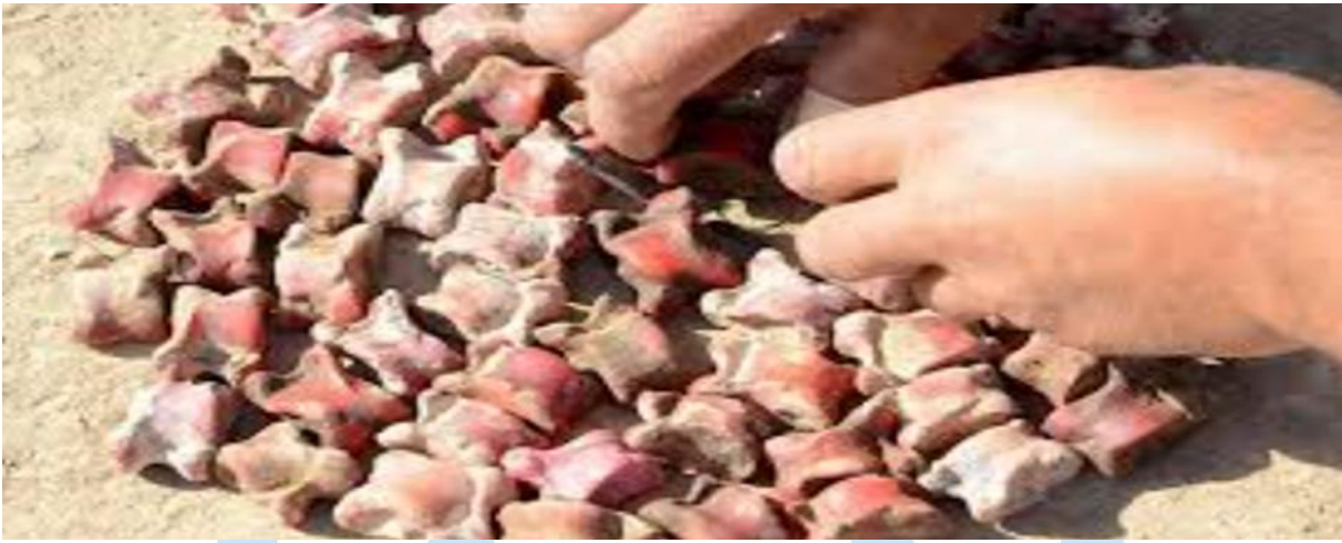
Şekil 2. Aşık kemiği görselleri