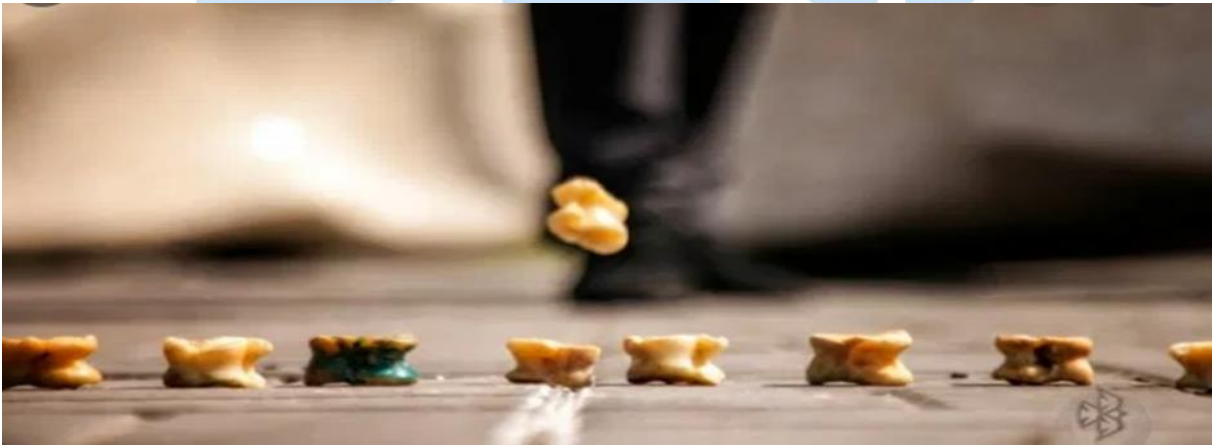
Şekil 3. Aşık kemiği oyunu örnekleri